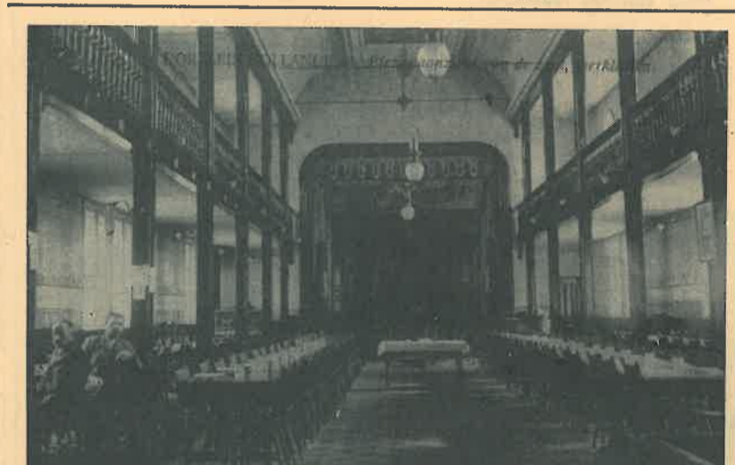
De K.Z.M.-Ontspanningszaal zoals zij voorheen was. In de moderne ogen ouderwets, maar voor de tijd, waarin zij gebouwd werd hypermodern.