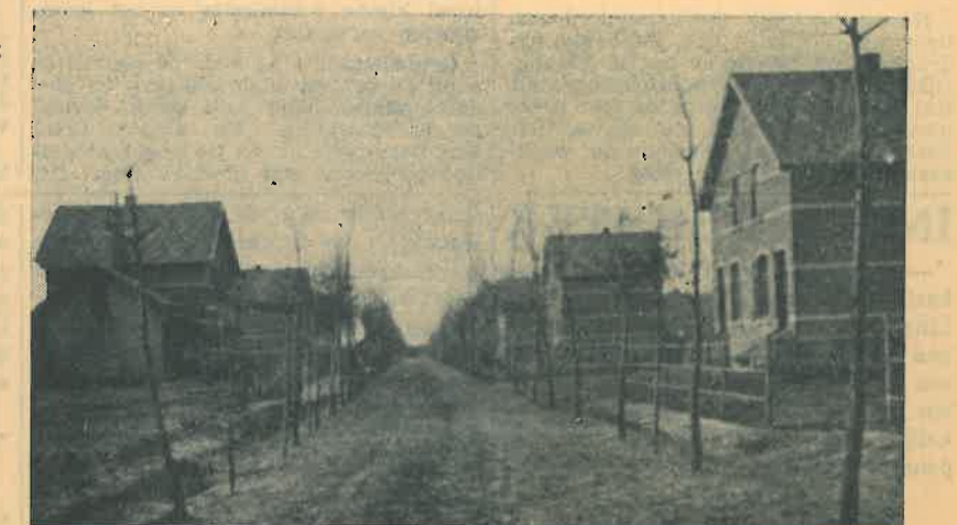
Een kijkje op de Mariastraat in haar eerste stadium. Woningen en wegen van pioniers!