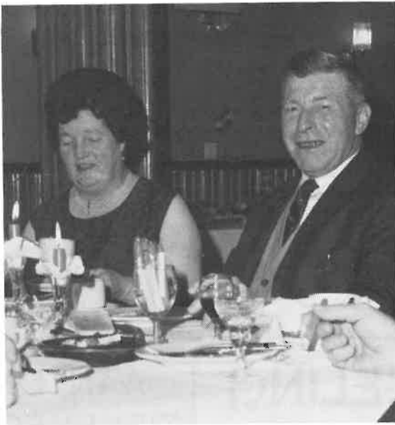
Ook hier is DAS in zijn sas

trolyse - hij zelf nog even bleef, totdat dit grote project gerealiseerd was.