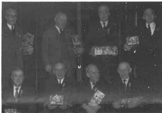
Zij, die onze bedrijven in 1968 met pensioen verlaten hebben!

Traditie getrouw trad ook de rijmdichter weer voor het voetlicht, waarbij van elke jubilaris het doopceel werd gelicht, wat telkens met een hartelijk applaus werd beloond.