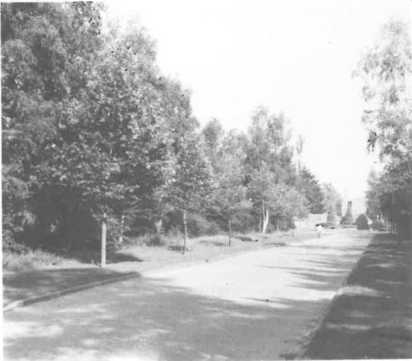
De groene oase links van de Barbaraweg richting de "Schakel".

Aan de linkerkant van het einde van de Barbaraweg, richting gemeenschapshuis "De Schakel", ziet U nu een groene oase waar vooral de vogels zich thuisvoelen. In deze driehoek, ingeklemd tussen de Stationsweg en de Barbaraweg, waar nu o.a huizen van het Pr. Cristinaplantsoen gebouwd zijn, duidt weinig er nog op dat hier 25 jaar geleden vijf kleine straatjes lagen, uitkomende op de Barbaraweg, met daaraan in totaal 19 woningen.