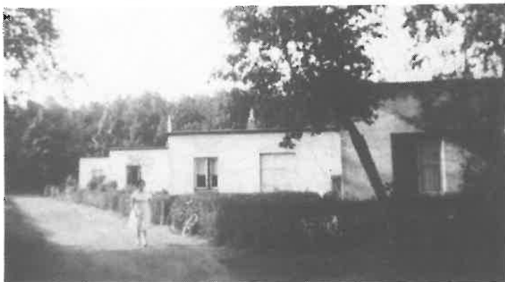
De vier noodwoningen aan de Cederweg. Over straat loopt Mientje Bergmans.

Er werden 5 straatjes aangelegd met daaraan in totaal 19 witgeschilderde woningen met alleen een benedenverdieping. Bij de straatnamenbenoemingen voor Dorplein in 1957 kregen de straatjes de volgende namen in alfabetische volgorde: Acaciaweg, Berkenweg, Cederweg, Dennenweg en Elzenweg. Ze werden daarom ook wel de ABC-straatjes genoemd. Ze werden zo genoemd vanwege de aanplanting met respectievelijk (pseudo)-acacia's, berken, ceders, dennen en elzen.