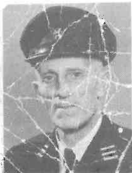
"Sikke-Bertje" zonder sik

Naast de ordehandhaving in het dorp had hij ook tot taak om op de fabriek als er "consoom" (14-daagse uitbetaling) was op de centen te passen, waarvoor hij een nacht op de fabriek moest blijven.