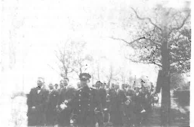
De gard tijdens een processie