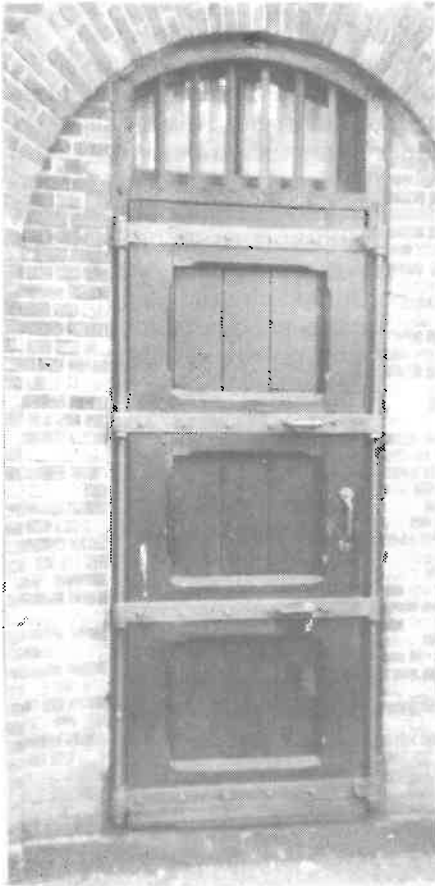
Zwaar geklompde gevangenisdeur

Het gebouwtje bevat twee identieke cellen in spiegelbeeld. De toegang tot iedere cel gaat via een zwaar geklompde deur met erboven een rond bovenlicht voorzien van tralies. Vroeger was achter deze deur nog een tweede deur aanwezig met doorgeefluik, maar deze zijn er later uitgehaald. Aan de achterkant bevindt zich voor iedere cel een getralied raam met luchtgat dat aan beide zijden is omgeven door metselwerk. Voor het luchtgat zat een met gaten voorziene plaat, waardoor de gevangenen konden communiceren met de buitenwereld. De cellen waren zeer eenvoudig uitgevoerd: een gewelfd plafond, bruine plavuizen en een luchtgat in het dak. Achter in de cellen stonden de kribben, die er nu nog in zitten, plusminus 90 cm breed 30-40 cm hoog met een opstaande rand van plusminus 10 cm. Hierop lag dan een strozak om op te slapen. Verder was er in iedere cel natuurlijk ook een toiletemmer aanwezig die 's morgens werd geleegd als de gevangene(n) werden gelucht.