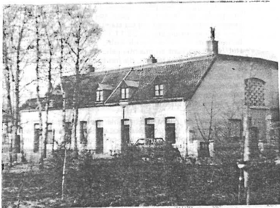
De tot woningen verbouwde boerderij

Van het eerste gedeelte van deze oude boerderij heeft men toen 3 woningen gemaakt. In het achterste gedeelte is sinds 1959 de postduivenvereniging 'De Gevleugelde Bode' gehuisvest.